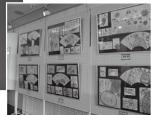
絵手紙も力作揃いです