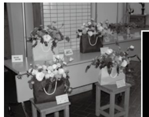
色鮮やかなフラワーアレンジメント

日頃鍛えた歌や踊りの発表・力作の作品展示・各種大会と内容も盛りだくさん。是非足をお運びください！