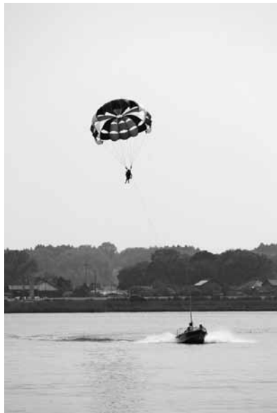
パラ・セーリングの特別試乗

パラ・セーリングは、パラシュートを装着して、ロープを使ってモーターボートで引っ張り、空中に舞上がるもので、今回、希望者に対し無料で実施されました。7月17日(土)から営業を開始します。(土・日・祝日のみ) 詳しくは、行方市観光協会、電話 0299-55-1221