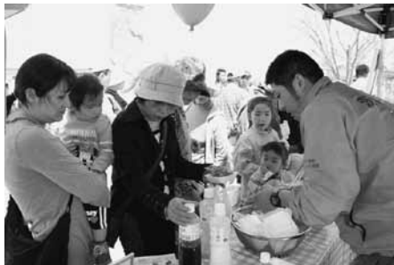
↑ 5/1 『なめがた大地の春まつり』

パラ・セーリングは、パラシュートを装着して、ロープを使ってモーターボートで引っ張り、空中に舞上がるもので、今回、希望者に対し無料で実施されました。7月17日(土)から営業を開始します。(土・日・祝日のみ) 詳しくは、行方市観光協会、電話 0299-55-1221