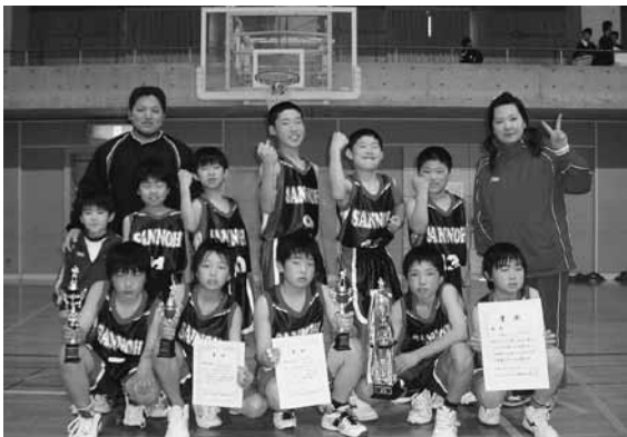
男子優勝 玉造山王ミニバス