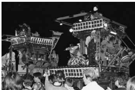
↑ 5/4・5 『玉造のおまつり(大宮神社例大祭)』開催

初代玉造城主がはじめたと伝えられ、端午の節句の時期に、子供たちの健やかな成長と、五穀豊穡を祈願するお祭りです。