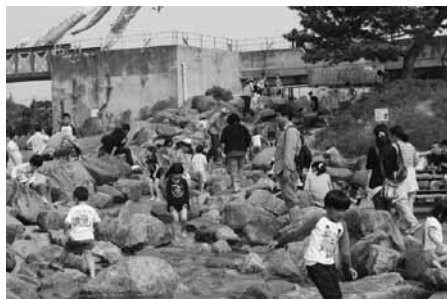
↑ 4/29～5/5 『お客さんコイまつり』

初代玉造城主がはじめたと伝えられ、端午の節句の時期に、子供たちの健やかな成長と、五穀豊穡を祈願するお祭りです。