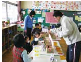
麻生幼稚園との交流