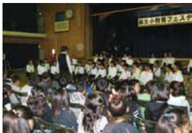
昨年の麻生小教育フェスティバル