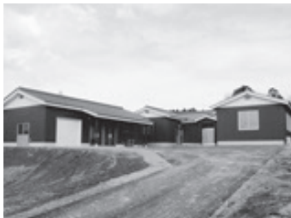
農業振興センター

農業者や子供たちをはじめとする幅広い市民や市内外の消費者が集い、農業に関する研究、意見交換、体験、学習等を行うための場を提供するとともに、本市の農業振興の拠点とする農業振興センターを設置するため、新たに制定しました。