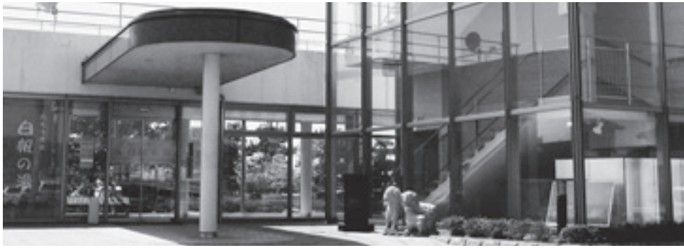
→あそつ温泉「白帆の湯」