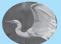
市の鳥 シラサギ(白鷺)