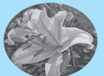
市の花 ヤマユリ(山百合)