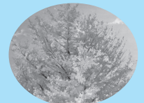
市の木 イチヨウ(銀杏)