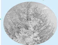
市の木 イチョウ(銀杏)