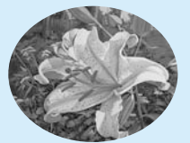
市の花 ヤマユリ(山百合)