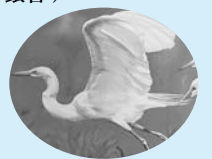
市の鳥 シラサギ(白鷺)