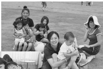
お散歩にいきました！

たいそうや人形劇、山百合の散策、バルーンアートやパン作りなどを月に1回程度実施しています。予約が必要な場合がありますのでお問い合わせ下さい。