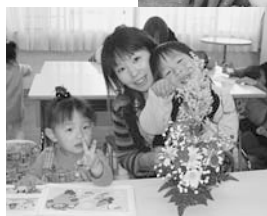
クリスマスにはアレンジメント作りました！