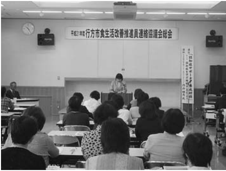
5月12日 総会を行いました

7月から養成講座を開講する予定です。食育や調理実習などの講習をとおして食に関する知識を身につけ、食生活改善推進員として活動してみませんか？お申し込みは、健康増進課（北浦保健センター）へお願いいたします。皆様の参加をお待ちしています！