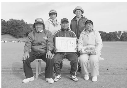
↑準優勝 豊和Aチーム