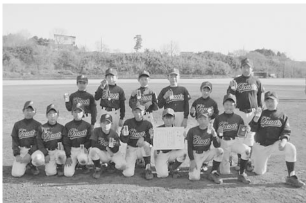
↑玉造ジャイアンツ