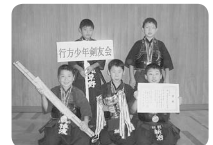
↑団体戦優勝 行方少年剣友会Aのみなさん