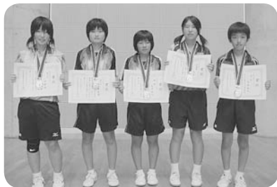
↑入賞された市内中学生のみなさん