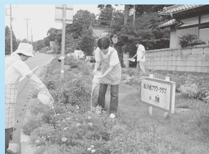
ペットボトルに保存した米のとぎ汁を草花にかける四鹿地区のみなさん