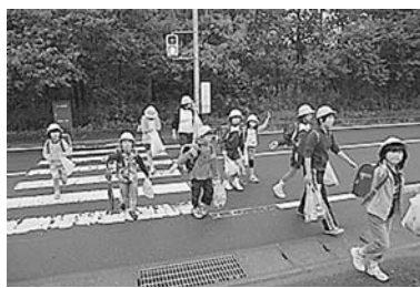
空き缶拾い登校をする武田小学校児童

環境保全行方市民会議が推薦した、市内人形劇団つくしんぼ(団体の部)と武田小学校(こどもの部)が4月30日に環境保全茨城県民会議総会時において、表彰を受けました。これは、環境教育の一環としての環境紙芝居上演や地域を巻き込んだ空き缶拾い登校などの環境保全運動が受賞の根拠となりました。つくしんぼはこの席でも紙芝居を上演し、行方市から環境保全運動を発信しました。市民会議は、今後もこのような団体の推薦を継続的にしていこうと考えております。