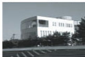
あそう温泉 白帆の湯