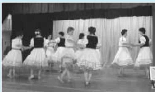
← フォークダンス (玉造)