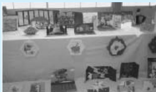
← ペーパークラフト (玉造)