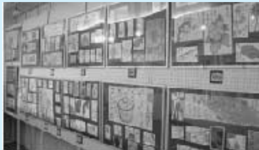
↑ 絵手紙 (北浦)

北浦文化会館を始め、各所で文化祭が開催され、作品展示や発表会が行われました。訪れた方々からは「すばらしい！」との感嘆の声があがっていました。