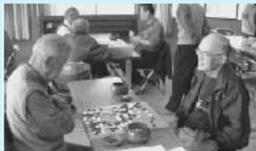
→ 囲碁大会 (北浦)