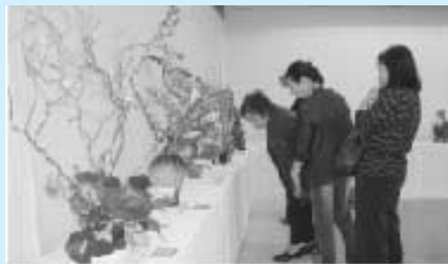
→ 生け花 (麻生)