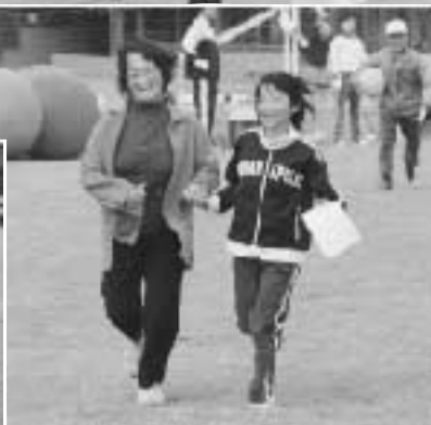
小学生とおばあちゃんが 一緒にゴール