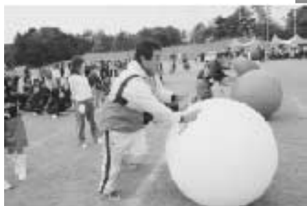
デカパンツを履いての大玉レース