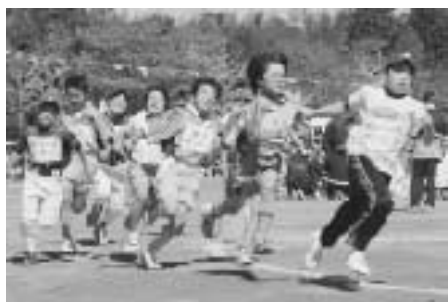
スポーツ少年団による 対抗リレー