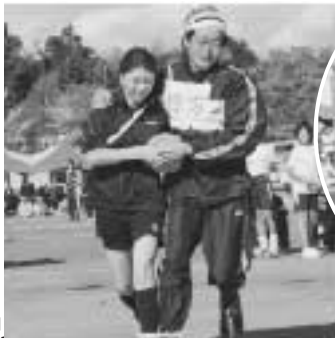
息も ぴったり 二人三脚!