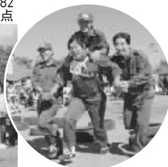
迫力のある騎馬戦リレー