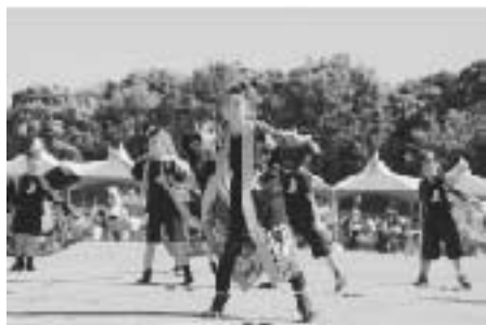
華麗な踊りよさこいソーラン

台風の接近などにより、グラウンドの状態が心配されましたが、当日は絶好の運動会日和に恵まれました。白熱した競技を各地区対抗で、楽しく繰り広げました。 【総合成績】 ・優勝 行方地区 得点 82点 ・2位 大和地区 得点 80点 ・3位 麻生地区 得点 76点