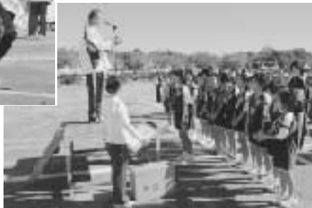
優秀な選手を表彰しました

台風の接近などにより、グラウンドの状態が心配されましたが、当日は絶好の運動会日和に恵まれました。白熱した競技を各地区対抗で、楽しく繰り広げました。 【総合成績】 ・優勝 行方地区 得点 82点 ・2位 大和地区 得点 80点 ・3位 麻生地区 得点 76点