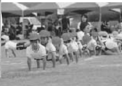
北浦保育園児による組体操