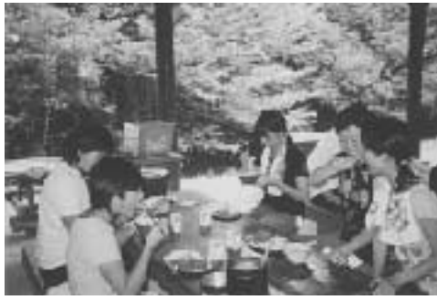
←とってもおいしいカレーが出来ました♪