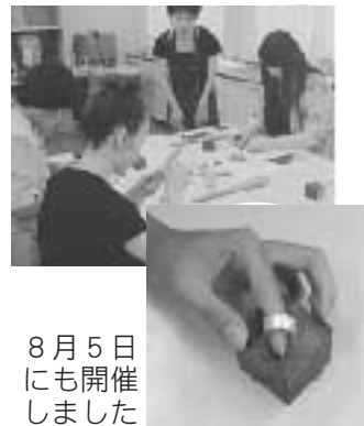
8月5日 にも開 しまし た