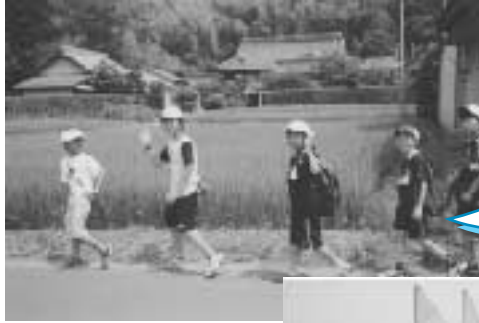
ハイキングに 出発だー!