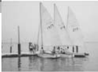
→初めてヨットとジェットスキーに挑戦しました!(天王崎にて)