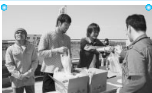
名良橋選手・首藤選手・内田選手（左から）も一役