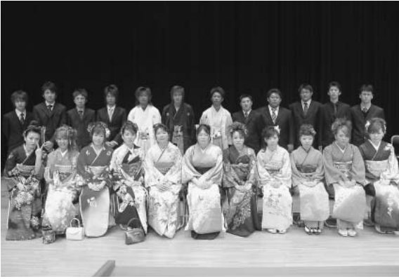
企画・運営を担った実行委員会のメンバー