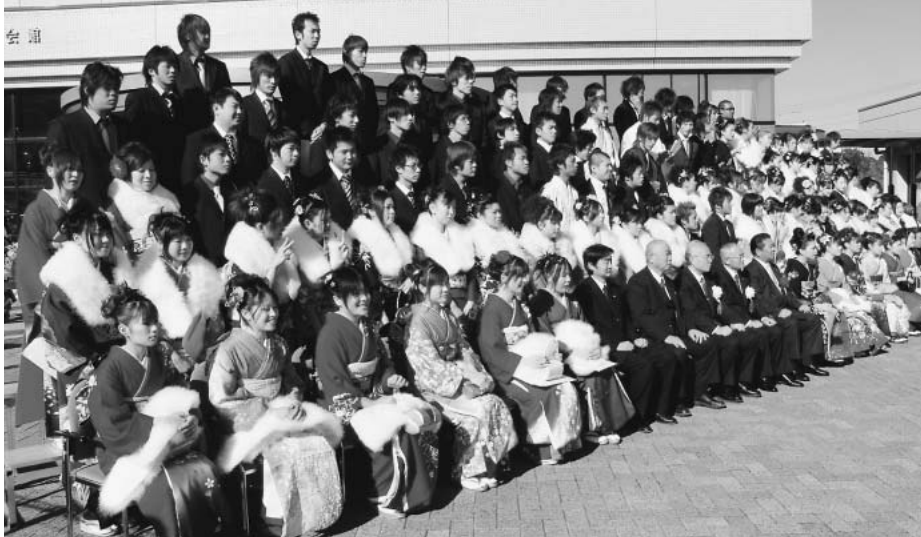
晴れ着で記念撮影に収まる新成人たち（行方市民会館）