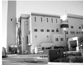
市で運営される環境美化センター