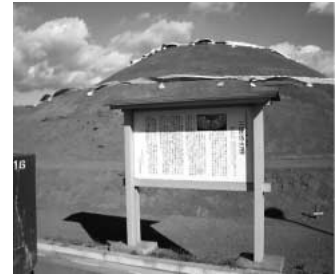
整備が進む三味塚農村公園