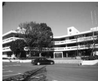
外壁が改修された麻生公民館