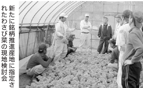
新たに銘柄推進産地に指定されたわさび菜の現地検討会

答 経済部長 農業振興センターの前身は、旧北浦町に平成元年に設置されたもので、麻生、玉造地区の皆様にはなじみの薄い部分もあるかと思いますが、その存在と活動は多くの農業者や市場関係者の皆様にご承知いた