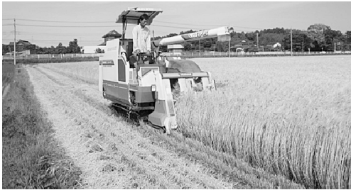
転作物である麦の収穫風景

答 市長 来年度も引き続き転作の推進方法の一つとして実施する方針で進めています。