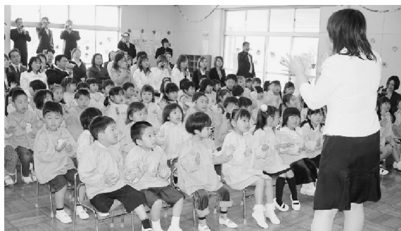
園児・保護者共に入園を楽しみにしています (北浦幼稚園)

生地区に幼稚園があってもなぜ北浦地区が無くなるのかという意見もいただいているので慎重に検討したいと考えています。