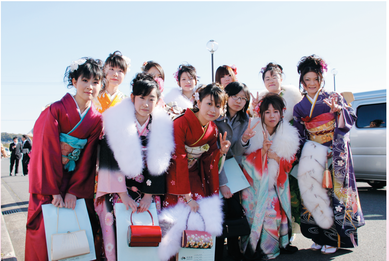
新たな門出を迎えて（行方市成人式）

発行:行方市議会 〒311-3512 行方市玉造甲404 TEL 0299 (55) 0111 発行者:行方市議会議長 平野晋一 編集:行方市議会広報委員会