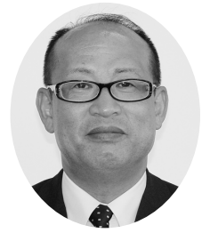
横田 太一 議員