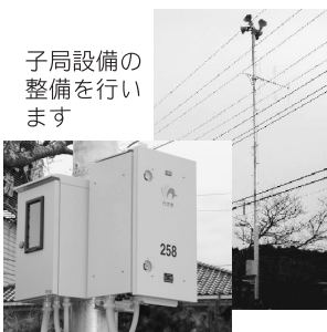
子局設備の整備を行います