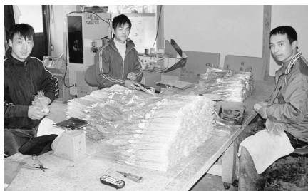
協同組合みさと園芸での研修・実習風景

答 市長 支援策は今のところなかなかできないのですが、よく部内で協議して、できることがあるとすれば、国・県など上部機関とも相談しながら、検討していきます。