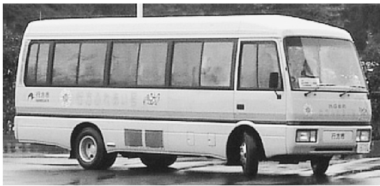
幹線型コミュニティバス「行方ふれあい号」

答 企画課長 新公共交通システム事業は、現在のデマンド型の乗り合いタクシー3台を来年度も3台で行っていく考えです。また、コミュニティバスは、現在、麻生、北浦地区で循環運行していますが、来年度は、玉造地区も運行していく考えです。なお、1年間の試